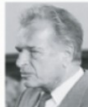
gen. Czesław Kiszczak

W wojsku od 1943 r. W latach 1945–1947 walczył ze zbrojnym podziemiem antykomunistycznym. W 1956 r. został generałem. Od 1968 do 1983 r. minister obrony narodowej. Odpowiedzialny za użycie wojska do krwawego tłumienia wystąpień grudniowych na Wybrzeżu w 1970 r. Członek Biura Politycznego KC PZPR i od 1981 r. I sekretarz oraz premier. 13 grudnia 1981 r. wprowadził stan wojenny i stanął na czele WRON.