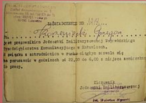
Przepustka zezwalająca na poruszanie w godzinach od 22 do 6 z miejsca zamieszkania do miejsca pracy