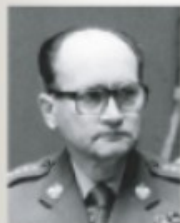
gen. Wojciech Jaruzelski

W wojsku od 1943 r. W latach 1945–1947 walczył ze zbrojnym podziemiem antykomunistycznym. W 1956 r. został generałem. Od 1968 do 1983 r. minister obrony narodowej. Odpowiedzialny za użycie wojska do krwawego tłumienia wystąpień grudniowych na Wybrzeżu w 1970 r. Członek Biura Politycznego KC PZPR i od 1981 r. I sekretarz oraz premier. 13 grudnia 1981 r. wprowadził stan wojenny i stanął na czele WRON.