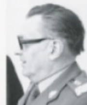
gen. Florian Siwicki

Od 1945 r. w wojsku jako funkcjonariusz organów wywiadu i kontrwywiadu. W latach 1986–90 członek Biura Politycznego KC. W latach 1981–90 minister spraw wewnętrznych. Członek WRON, uczestniczył w przygotowaniu i realizacji stanu wojennego. Oskarżony o przyczynienie się do masakry górników z kopalni „Wujek”. W 2102 r. skazany w procesie dotyczącym wprowadzenia stanu wojennego.