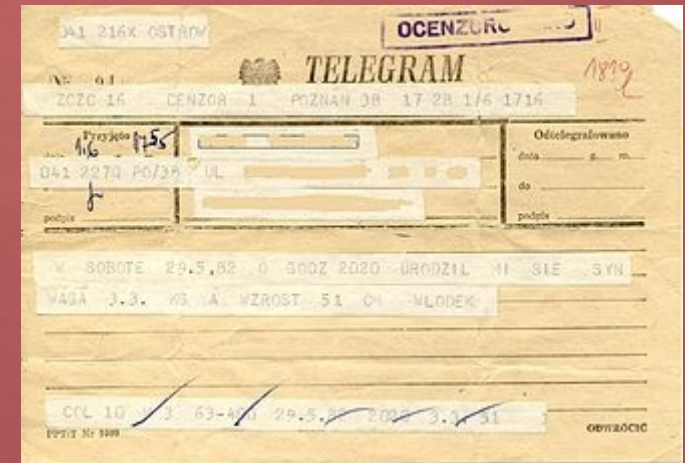
Ocenzurowany telegram z okresu stanu wojennego