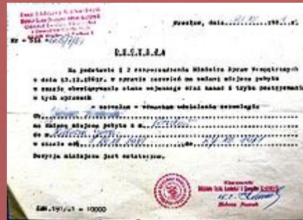
Jednorazowa przepustka zezwalająca na wyjazd na święta do innego miasta